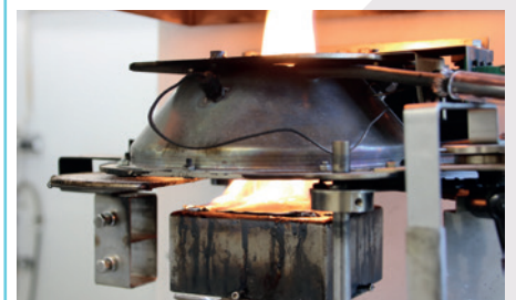
Essai au cône calorimètre

Trois centres menant une recherche de pointe pour et avec les entreprises.