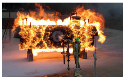
Essai de feu de torche de propane au GESIP