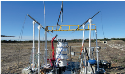
Prototype d'étude du BLEVE d'eau (300°C; 85 bar)