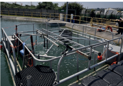
Essais de BLOW OUT de gaz naturel

Le risque d'explosion de l'enceinte pressurisée et les effets d'onde de surpression en champ proche ont été caractérisés.